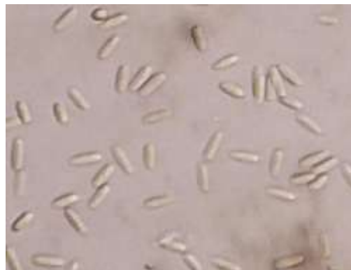
Gambar 2. Morfologi konidia Acremonium sp. (400x)

Bentuk morfologi konidia jamur Acremonium sp. yaitu memiliki bentuk konidia silindris dan berwarna bening serta bercabang (Gambar 2). Hasil identifikasi ini didukung oleh Watanabe (2010) dan Podoba (2024) menyatakan bahwa, genus Acremonium memiliki konidia bening, dan bercabang. Massa spora dari kumpulan konidia membentuk bulat, konidia silinder atau panjang elips serta bening.