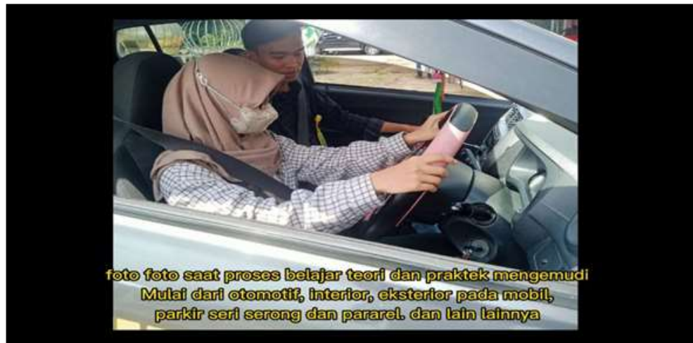
Gambar 3 : Aktivitas AE Ketika tidak bermain aplikasi tiktok

Begitu juga yang disampaikan oleh informan-informan berikutnya, sebagai berikut: