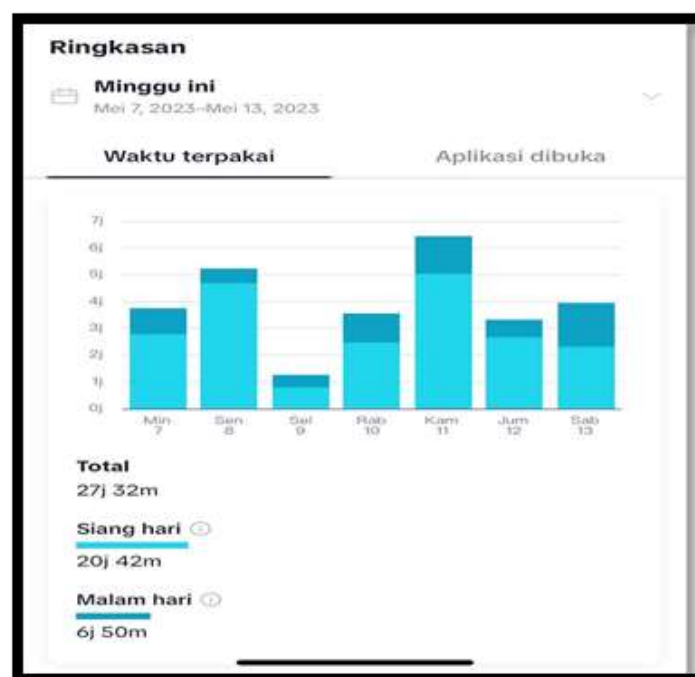
Gambar 5: Tabel Pemakaian Aplikasi Tiktok ISD

“Jawabannya tidak pernah pernah mungkin karena sudah terlanjur kecanduan jadi se menit saja tidak membuka aplikasi Tiktok nya kayak ada yang kurang karena dimulai dari siang hari sampe malam sudah membuka aplikasi Tiktok” (Iklesi Sekar Dinanti, wawancara pada tanggal 3 April 2023 pukul 11.12 wib)